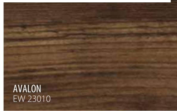
AVALON EW 23010