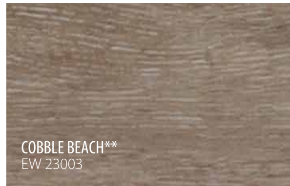
COBBLE BEACH** EW 23003