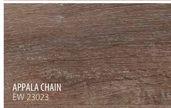
APPALA CHAIN EW 23023